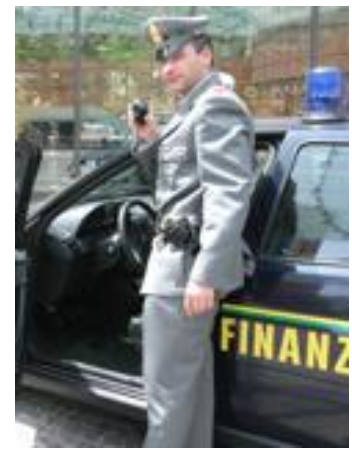
Operazione della Finanza (archivio)

il passaggio di denaro con il quale i tre consumatori avevano appena saldato quanto dovuto per l'acquisto della cocaina: un'azione inequivocabile, nota la quale le due pattuglie impegnate nell'operazione sono entrate in azione neutralizzando sia lo spacciatore che i suoi clienti, tre ragazzi dell'età compresa tra i 24 e i 27 anni.